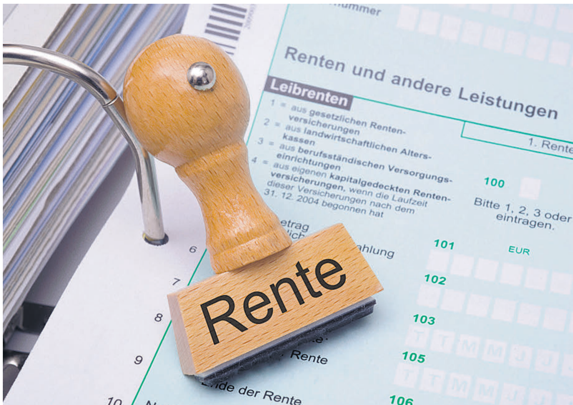
Nach der Pensionierung muss in der Regel der Gürtel enger geschnallt werden. Vorsorglich kann dies jedoch mit erhöhten Sparbeiträgen verbessert werden.

Es macht auch Sinn, seinen Partner in der Pensionskasse zu prüfen, wenn dies möglich ist. Daher sei es umso wichtiger, dass wir unsere Eigenverantwortung wahrnehmen und zusätzlich selber sparen. In der Schweiz wird dieses System steuerlich begünstigt, was das die beiden Säulen natürlich massiv stützt. «Daher wünsche ich mir dieses System der Säule 3a in Liechtenstein auch», so der Insurance Broker. Sich in Liechtenstein in die Pensionskasse einzukaufen ist natürlich möglich. Auch für Liechtensteiner sind diese Einkäufe zwar steuerlich begünstigt, jedoch